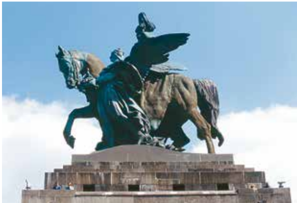
Reiterstandbild „Deutsches Eck“

Umrahmt von vier Mittelgebirgen mit vielen Wald- und Grünflächen, liegt Koblenz, eine der schönsten und ältesten Städte Deutschlands. Das weltweit bekannte „Deutsches Eck“, erhielt den Namen im Jahr 1216 durch die Ansiedlung des Deutschen Ordens. 1945 wurde das Reiterstandbild zerstört. 1993 wurde eine Nachbildung des Reiterstandbildes Kaiser Wilhelms I. offiziell enthüllt.