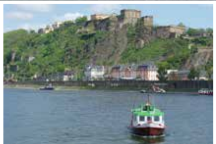
Blick auf die Festung Ehrenbreitstein

Umrahmt von vier Mittelgebirgen mit vielen Wald- und Grün-